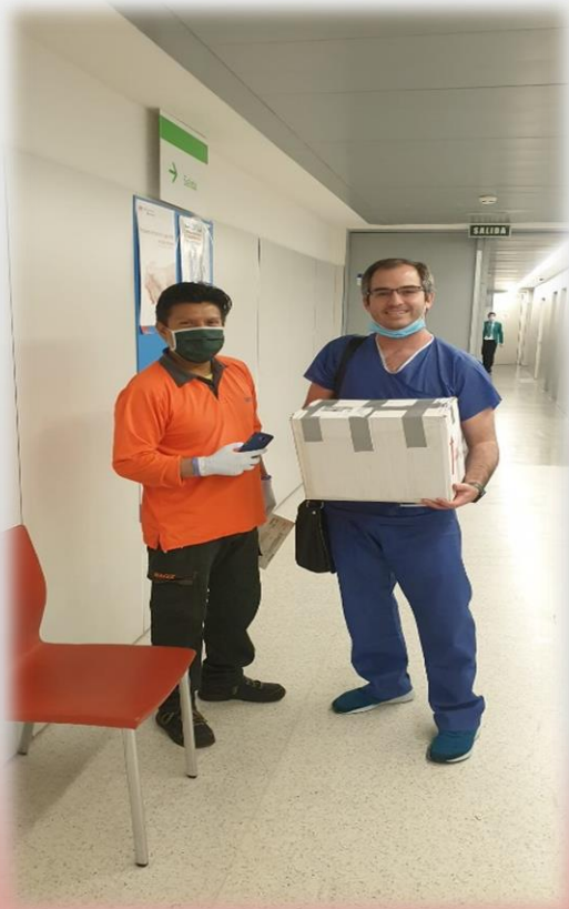
Donación de mascarillas.