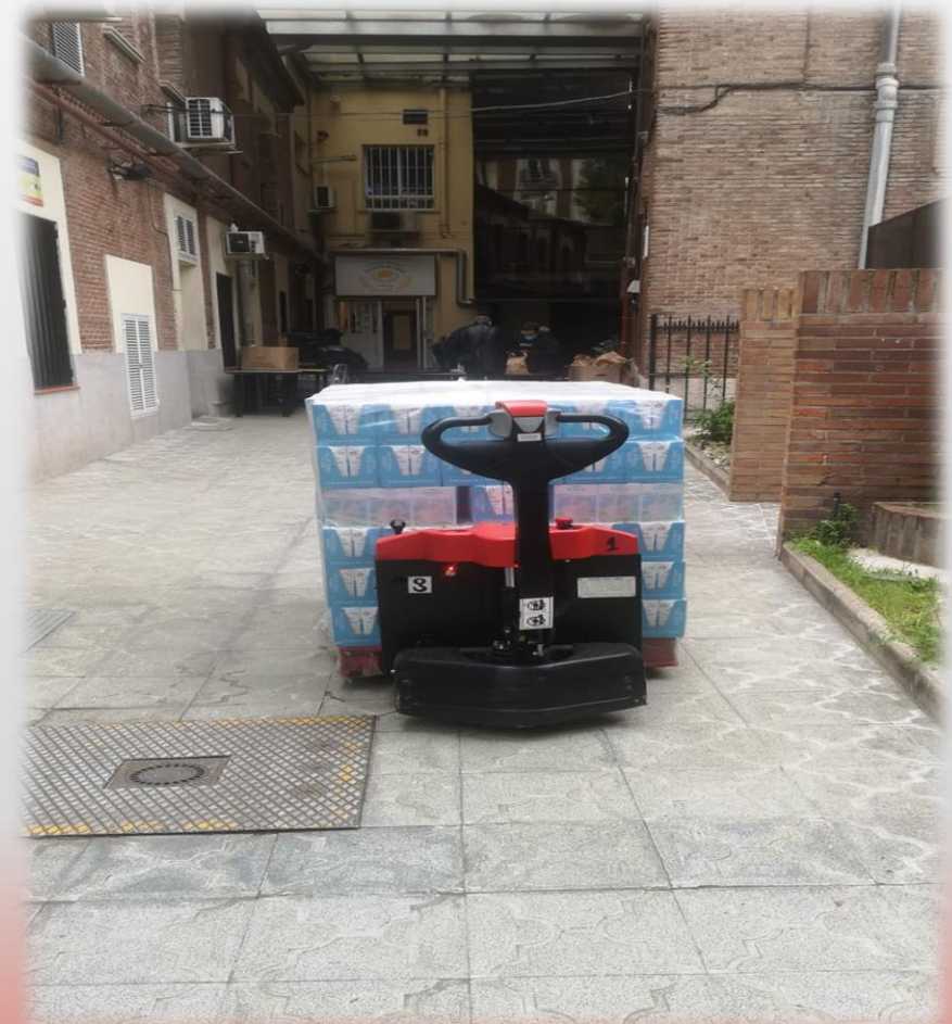
Donación de gel desinfectante