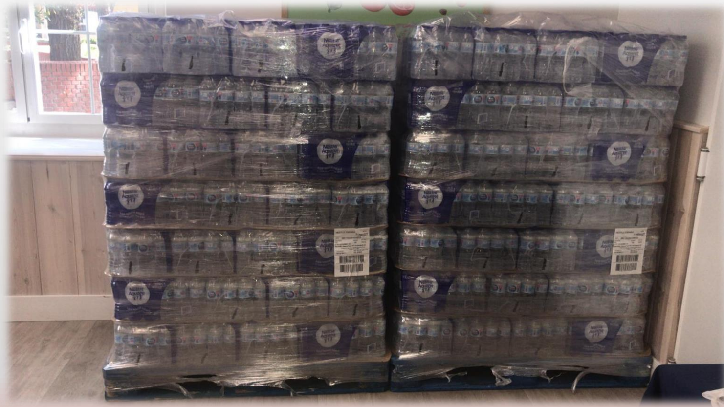
Donación de botellas de agua.